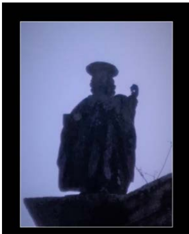
Teatralidad y textualidad en el Arcipreste de Talavera